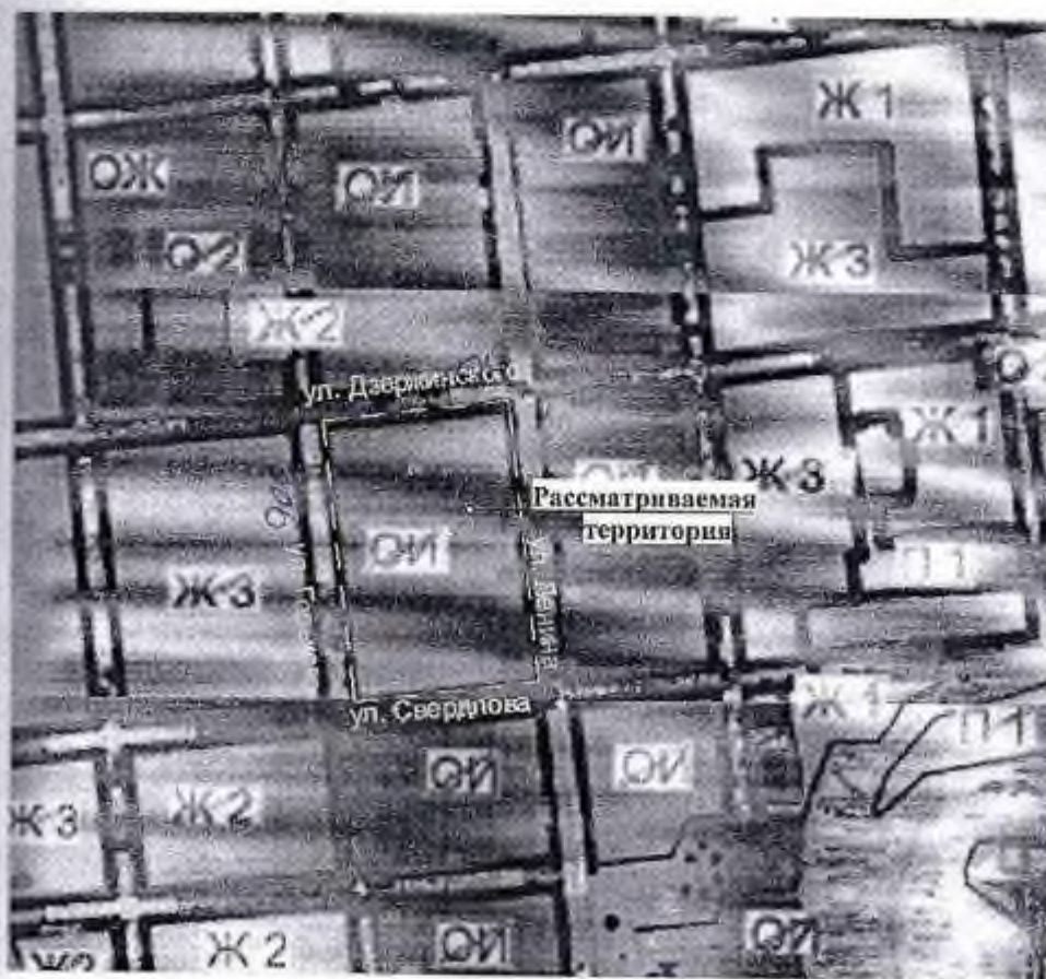
Фрагмент карты Правил землепользования и застройки города Ливны Орловской области

Схема территории, ограниченной ул. Дзержинского, ул. Ленина, ул. Свердлова, ул. Горького в границах кадастрового квартала номер 57:26:0010220 в городе Ливны Орловской области