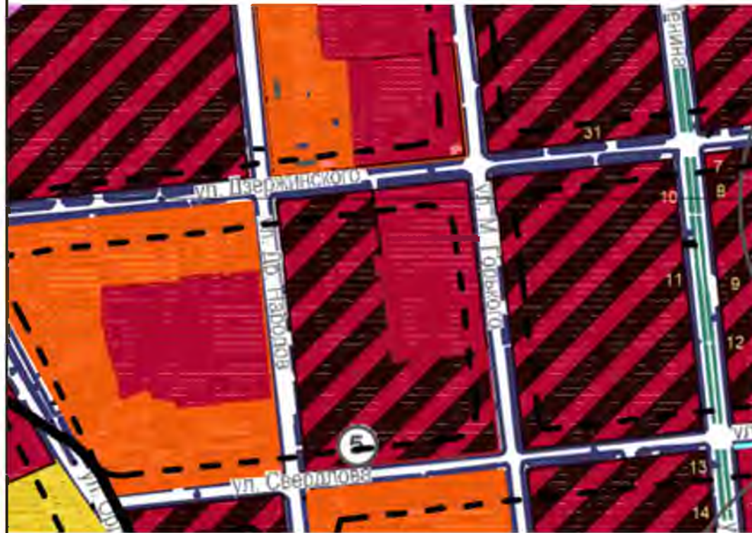
Схема ограничений использования территории (Генеральный план города Ливны Орловской области)